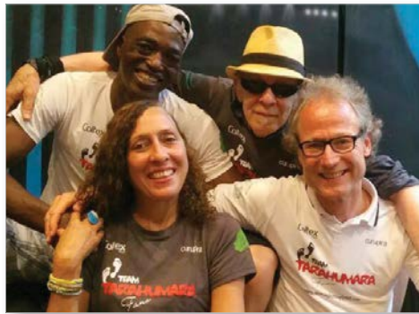
Jazz'ens for the Planet